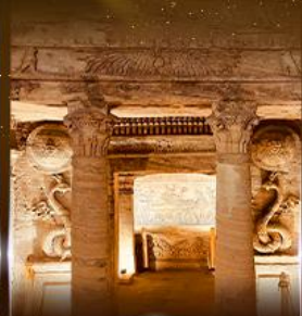
สุสานใต้ดินอเล็กซานเดรีย