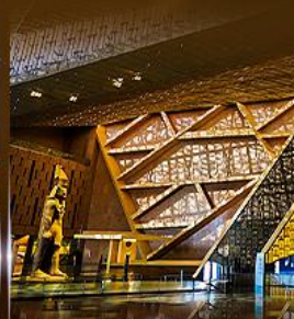
พิพิธภัณฑ์ไทรนิตี้อียิปต์ (GEM)