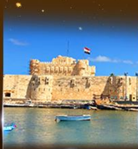
บึงนรากรม Quite Bay