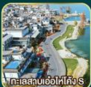
ทะเลสาบเอ๋อไห่คัง S