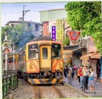
สถานีรถไฟซือเฟิ่น