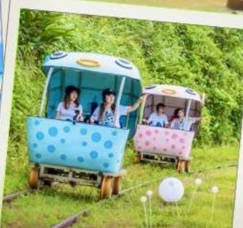
Shen'ao Rail Bike