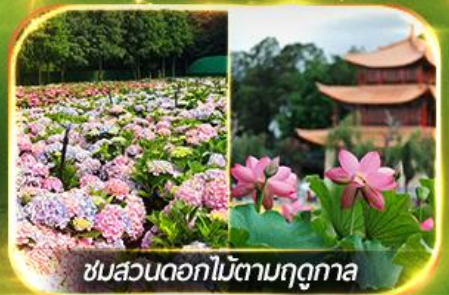
ชมสวนดอกไม้ตามฤดูกาล

นั่งกระเช้ากุเขาสหะเจี้ยวจื่อ ชมน้ำตกสุดอลังการสวนน้ำตกคุนหมิง ช้อปปิ้งถนนคนเดินหนานผิงเจี๋ย, ชมดอกไม้ตามฤดูกาล