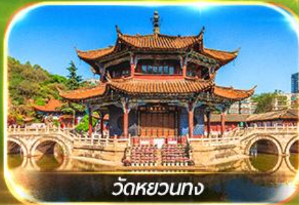
วัดหยวนทาง