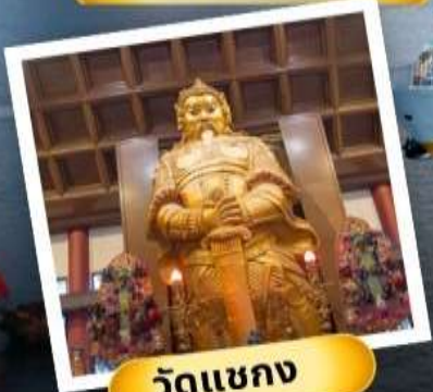
วัดเขากง