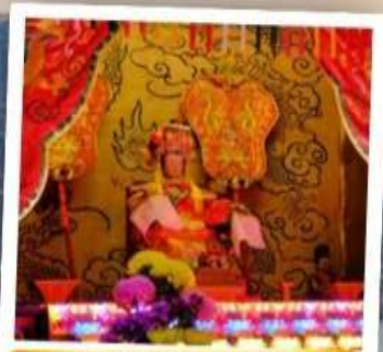
เจ้าแม่ทับทิม จอสเฮ้าส์เบย์