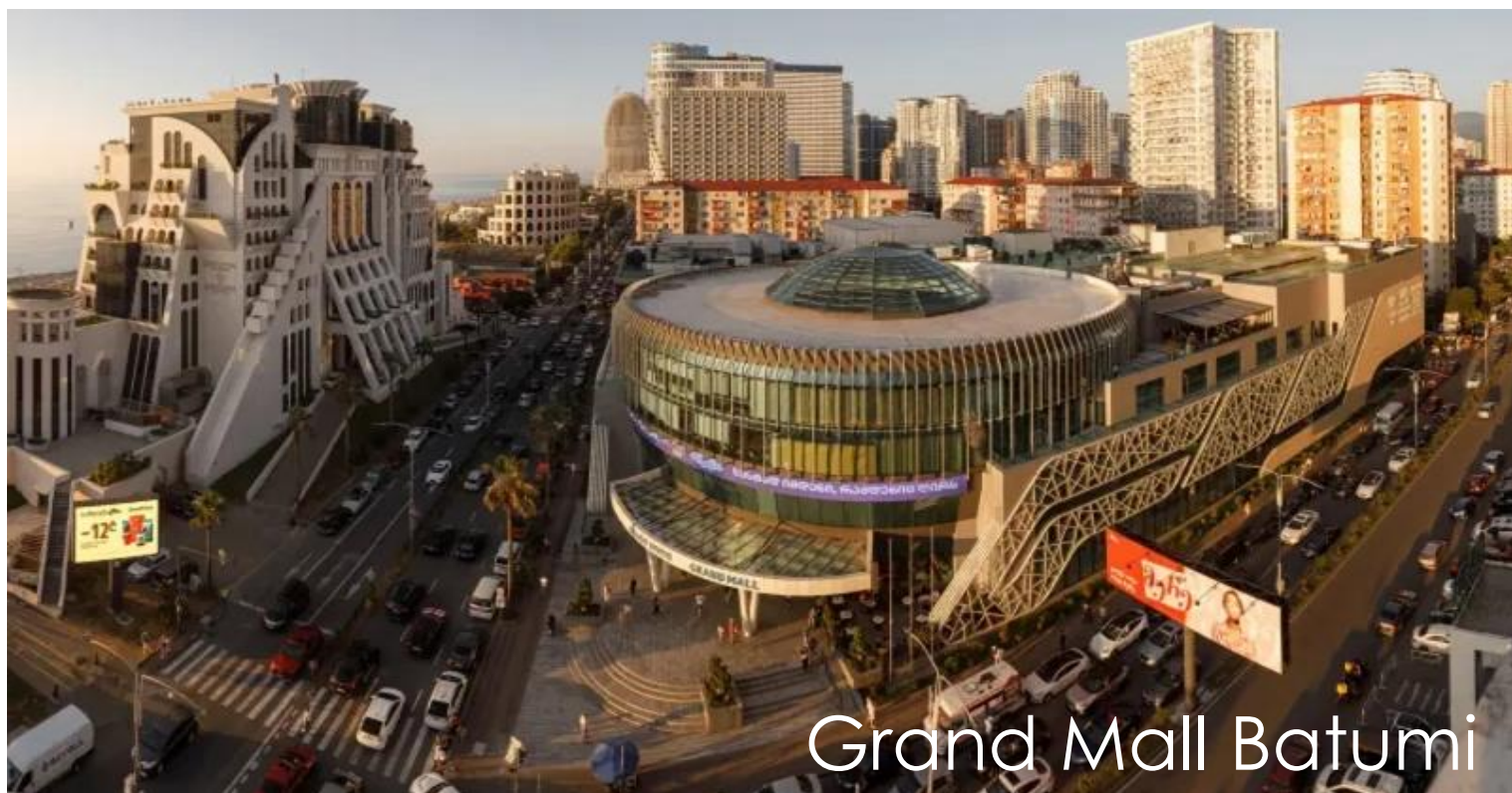
Grand Mall Batumi

ก่อนเดินทางกลับโรงแรม นำทุกท่านแวะช้อปปิ้งที่ Grand Mall Batumi ศูนย์การค้าขนาดใหญ่ของเมือง รวบรวมร้านค้าแบรนด์ดัง ร้านอาหาร และโซนบันเทิงมากมาย ก่อนให้ท่านได้อิสระช้อปปิ้งตามและรับประทานอาหารเช้าตามอัธยาศัย