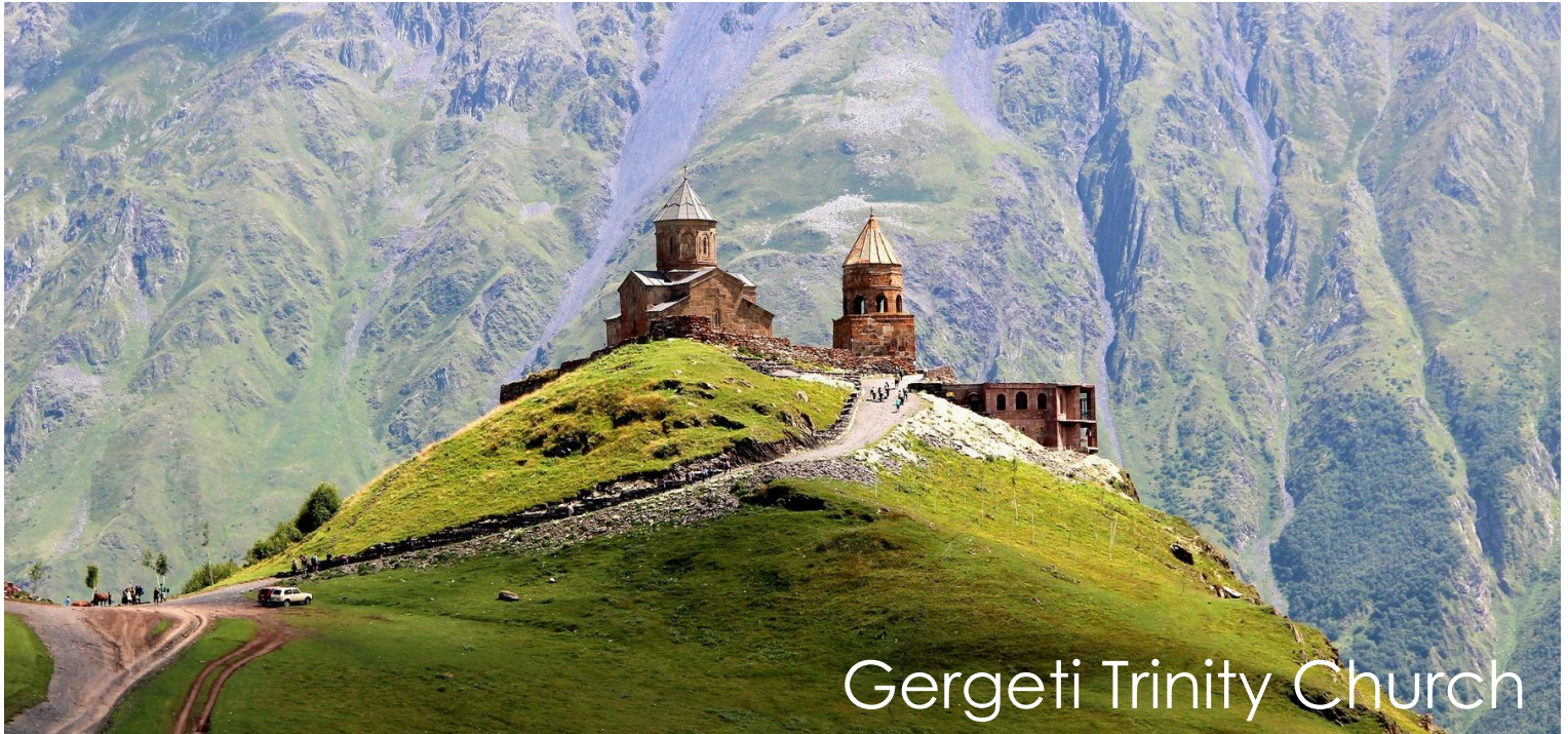
Gergeti Trinity Church

ตั้งอยู่บนเทือกเขาคอเคซัสเบกที่ระดับความสูงจากน้ำทะเล 2,170 เมตร (ในกรณีที่มีหิมะตกหนัก จนไม่สามารถเดินทางได้ ทางบริษัทขอสงวนสิทธิ์ ปรับเปลี่ยนโปรแกรมตามความเหมาะสม)