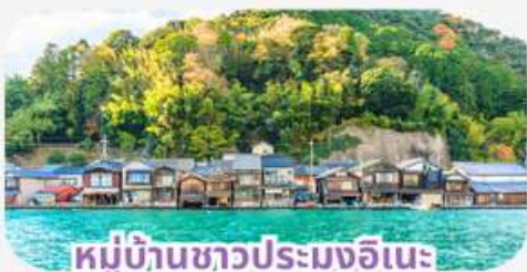
หมู่บ้านชาวประมงอิเนะ