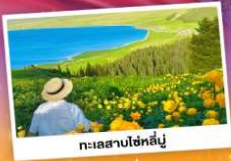
ทะเลสาบไซหลิน

ถ่ายรูปทุ่งดอกลาเวนเดอร์ - กุ่หงุ่ยช่าลาจัน SKY GRASSLAND กุ่หงุ่ยช่าลาจันระดับโลก