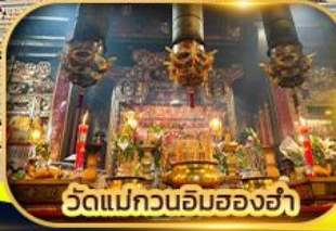
วัดแม่กวนอิมฮ่องฮ่า