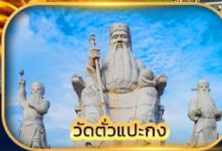
วัดตัวแปะกง