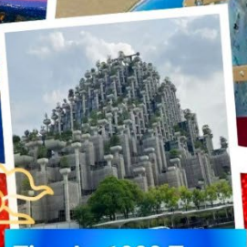
Tian An 1000 Trees