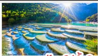
ภูเขาพระจันทร์สีน้ำเงิน

ภูเขาหิมะมังกรหยก - เมืองโบราณแสงกรี่ล่า วัดลามะชงจ้านหลิน - รถไฟขบวนวิภูเขาหิมะมังกรหยก สวนดอกไม้ฮาวอวู๋มู่ฉ่าง - เมืองโบราณลี่เจียง ภูเขาพระจันทร์สีน้ำเงิน - เหมบูฟิเศษ สุกีปลาแซลมอน