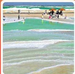
ทะเลสาบเกลือจาเอ้อหนาน