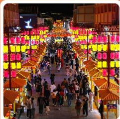
ตลาดกลางคืนซาโจว