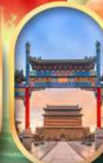
ถนนคนเดินเทียนเหมิน