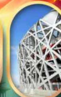
ผ่านชมสนามกีฬาฟาริงก