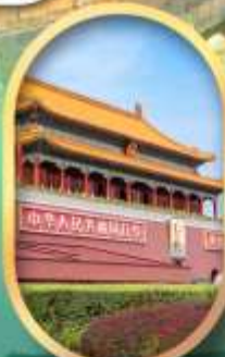
จัสมุตรีสเทียนอันเหมิน