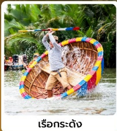
เรือกระดง