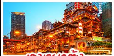
เจียงเฉาตัง