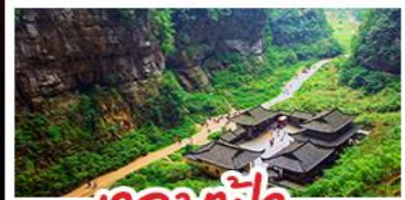
เจ๋อหลิง