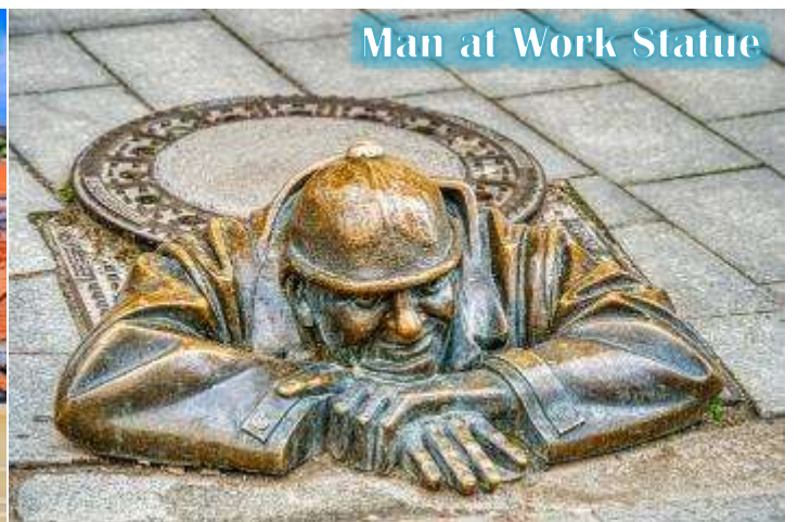
Man at Work Statue