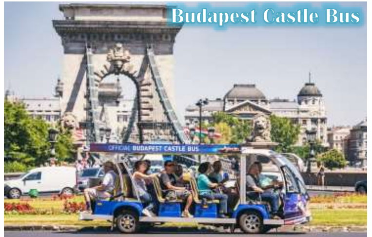
Budapest Castle Bus

บูดา Castle Hill *เนื่องจากตัวปราสาทตั้งอยู่บนเนินเขา การเดินทางโดยรถไฟไฟฟ้า จะเพิ่มความสะดวกสบายให้กับท่าน โดยรถไฟไฟฟ้าจะจอดรับและส่งตามจุดต่างๆ ในย่านเมืองเก่า ไม่ต้องเดินเท้าเป็นระยะทางไกล* จากนั้นนำท่านเดินชมความงดงามของเมืองเก่ารอบๆปราสาทบูดา ที่เริ่มมีการก่อสร้างมาตั้งแต่ปี ค.ศ.1265 และต่อเติมปรับปรุงมาโดยตลอด จนกระทั่งปัจจุบัน โดยตัวอาคารในปัจจุบันเราจะเห็นเป็นสไตล์บาโรค ที่ดู