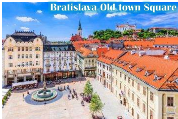
Bratislava Old town Square

บ่าย นำท่านเดินทางสู่กรุงบราติสลาวา, ประเทศสโลวัก นำท่านเข้าชมเมืองเก่าบราติสลาวา สัมผัสบรรยากาศเมืองเก่า และถ่ายภาพกับโรงละครโอเปร่า สัญลักษณ์แห่งความหรรษาของประเทศ และเก็บภาพรูปปั้นที่ซ่อนอยู่ในตัวเมือง ไม่ว่าจะเป็นรูปปั้นโปเลียนหน้าสถานทูตฝรั่งเศส หรือรูปปั้นปาปาริซซ์รวมถึง ไฮไลต์ของเมืองคือรูปปั้นของคนที่ตกท่อคูมิล” (Man at Work) ที่โด่งดัง ณ แห่งนี้เคยถูกรถชนมาแล้วถึง 2 ครั้ง ในปัจจุบันจึงมีป้าย เขียนว่า “Man at Work” ปักอยู่บริเวณดังกล่าว เป็นสัญลักษณ์ช่วงที่เป็นคอมมิวนิสต์ และตำนานยังคงเล่าต่อไปว่าอาจจะเป็นคุณลุงที่เหน็ดเหนื่อยกับการทำงานอยากจะพักผ่อนบ้างตามประสานักงานหนัก จากนั้นนำท่านชม “ประตูไมเคิล” ซึ่งซุ้มประตูไมเคิลก่อสร้างสไตล์โกธิคสูง 51 เมตร มีอยู่ทั้งหมด 4 แห่ง ปัจจุบันเป็น ประตูเพียงแห่งเดียวที่ยังเหลืออยู่ ประตูไมเคิลมียอดโดมทรงหัวหอมตามศิลปะบารอก 3 ชั้น ลดหลั่นกัน ประตูแห่งนี้ตั้งอย่างศูนย์กลางเมืองเก่า สองฝั่งถนนมีอาคารเก่าแก่หลาก สี สัน สไตล์อาร์ตนูโวตั้งเรียงรายอยู่ทำให้บรรยากาศคึกคัก