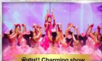
พิเศษ!! Charming show