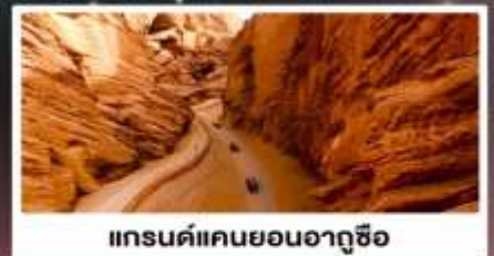
แกรนด์แคนยอนอาถูซือ