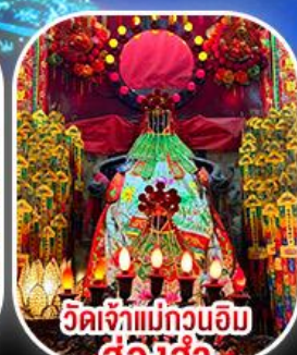
วัดเจ้าแม่กวนอิม ฮ่องฮำ