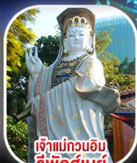
เจ้าแม่กวนอิม รีพีลส์เบย์