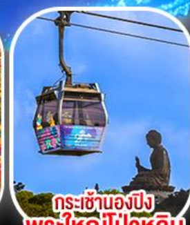
กระเช้าเองปีง พระใหญ่โป่วหลิน