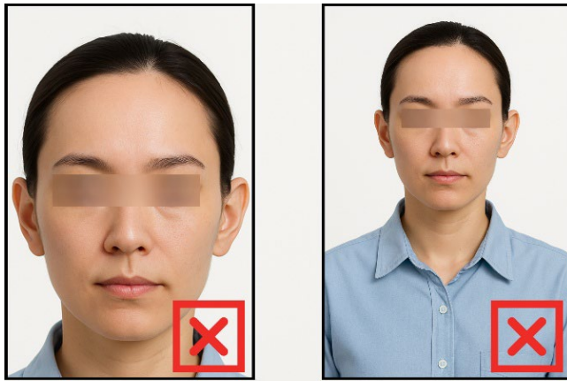
รูปที่ไม่ได้ขนาด ตามที่สถานทูตกำหนด