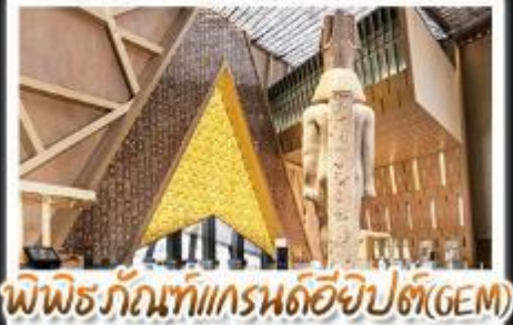
พิพิธภัณฑ์แกรนด์อียิปต์(GEM)

อารยธรรมลุ่มแม่น้ำไนล์ - พีระมิด - อเล็กซานเดรีย - เมมฟิส - ไคโร - โรงแรมระดับ 4 ดาว รวมค่าวีซ่า ครอบคลุมเอกสาร - อาหารครบทุกมื้อ