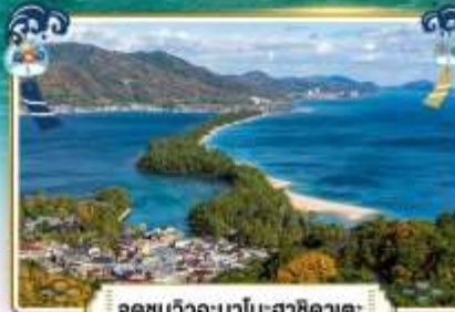
จุดชมวิวอะมาโนฮาชิคาตะ