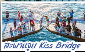
สะพานจูบ Kiss Bridge