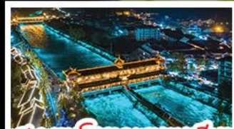
สะพานโบราณเขานางฟ้า