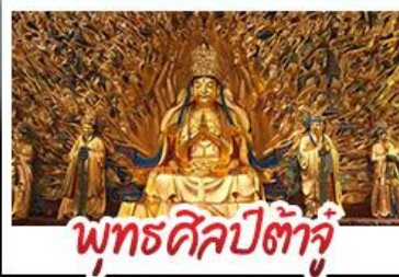
พุทธศิลป์ต้าจู๋