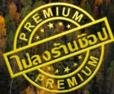
หาดห้าสี