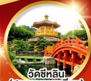
วัดชี่หลิน (สวนหนานเท่หลิน)