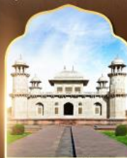
ถ้ำมาชานน้อย