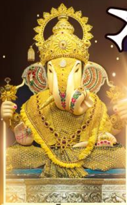
องค์ดีกษุท์เศษฐ์