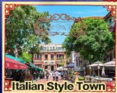
Italian Style Town