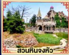
สวนหินจิ้งหิว