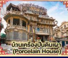
บ้านเครื่องปั้นดินเผา (Porcelain House)