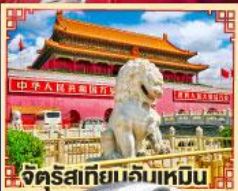
จักรีเสเทียนจันเหมิน