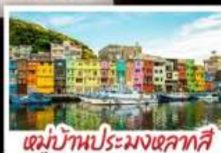
หมู่บ้านประมงหลากสี