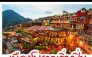
เมืองโบราณจิ่วเฟิ่น

ฟาร์มแกะชิงจิ้ง - ทะเลสาบสรียันจินตรา จิ่วเฟิ่น - หมู่บ้านประมงหลากสี - ไทเป 101 หมู่บ้านสายรุ้ง - ตลาดล่าหู่ & ซีเหมินติง ปลาประ-ธานาธิบดี - เขียวหลงเป่า