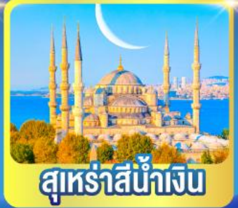
สุเหร่าสีน้ำเงิน