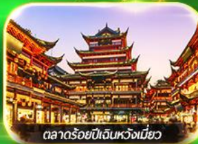
ตลาดร้อยปีเงินหวังเหมียว