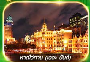
หาดไข่มุก (เดอะ บันด์)

เที่ยวมหานครเซี่ยงไฮ้ ถ่ายรูปเช็กอินที่ Tian An 1000 Trees, ซินเทียนตี้ ช้อปปิ้งตลาดเงินหวังเหมียว, ถนนนานกิง