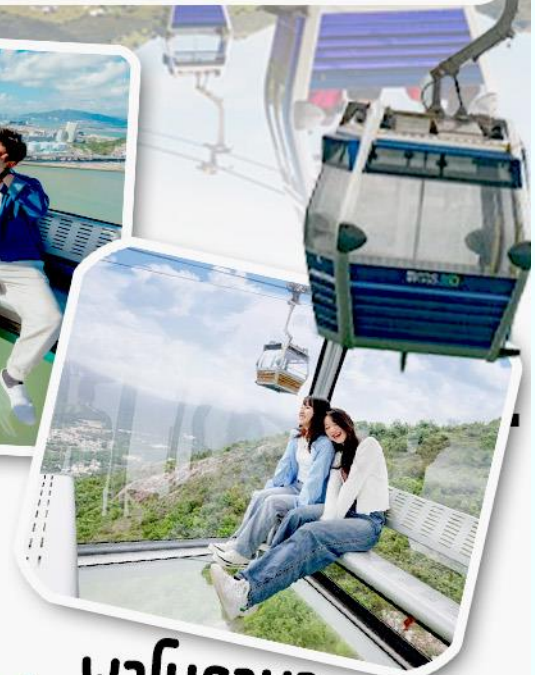
พานิราม่า