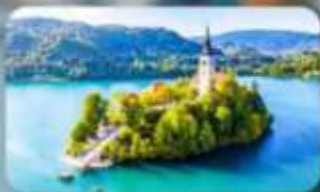
โบสถ์พระแม่มาเรียแห่งบลัด