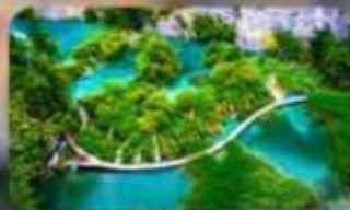
อุทยานแห่งชาติพลีทวิเซ่