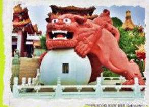
วัดเขวียนหวู