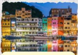
ทะเลสุริยขึ้นฉันทรา