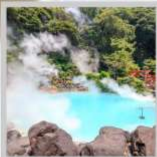
"BEPPU UMI JIGOKU"