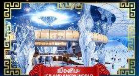
เมืองหิมะ ICE AND SNOW WORLD