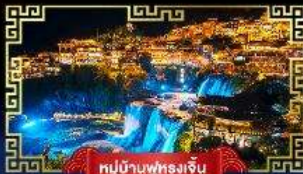
หมู่บ้านฟูหลงเจิน